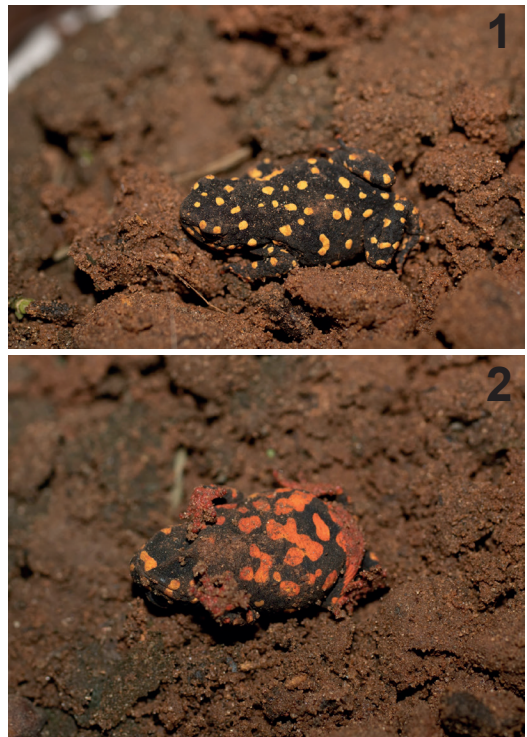
Figuras 1-2. Ejemplar 1 de Melanophryniscus fulvoguttatus . 1) Vista dorsal. 2) Vista ventral.

La nueva cita es para el Departamento de Caazapá, el cual acorta las distancias entre los registros anteriores. El ejemplar 1, un macho (Figs. 1-2), fue encontrado en la Compañía 20 de Julio de la ciudad de Caazapá, Departamento de Caazapa, el 13 de septiembre de 2023 coordenadas 26°09'30.0"S 56°21'36.0"W en